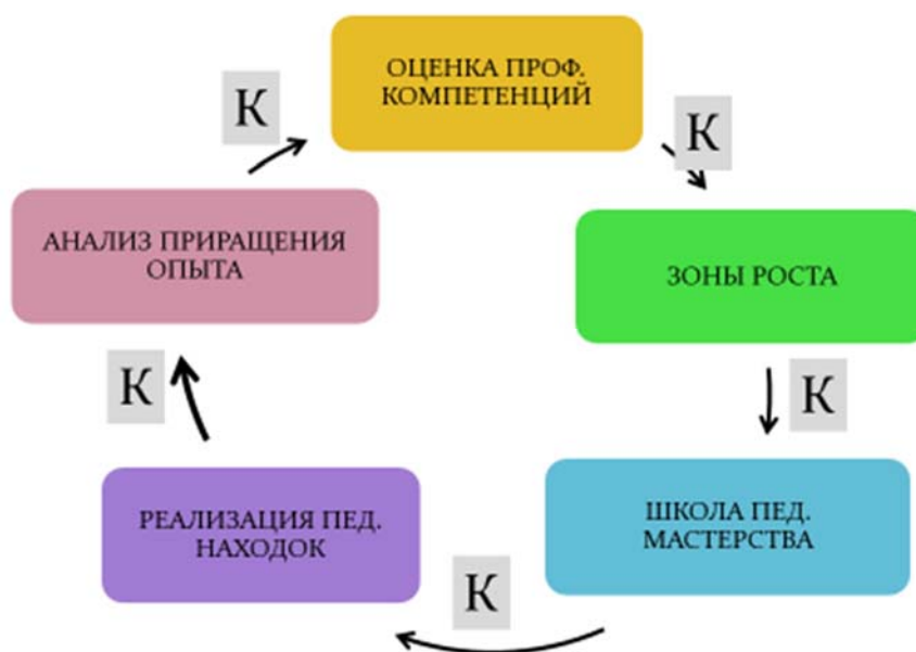
Рис.2. Цикл приращения профессиональных компетенций педагогов.

Сформированные программы обсуждаются на Методическом совете, утверждаются Педагогическим советом и корректируются каждое полугодие по итогам комплексной оценки профессионального развития. В зависимости от содержания программ формируются проектные команды педагогов, участвующие в системе методических стажировок, курсах повышения квалификации, творческих объединениях и иных формах профессионального развития с обязательным обсуждением результатов работы групп на педагогических советах и внешних формах апробации результатов (конференциях, сетевых сообществах, публикациях). Таким образом, формируется цикл приращения профессиональных компетенций педагогов (рис.2).